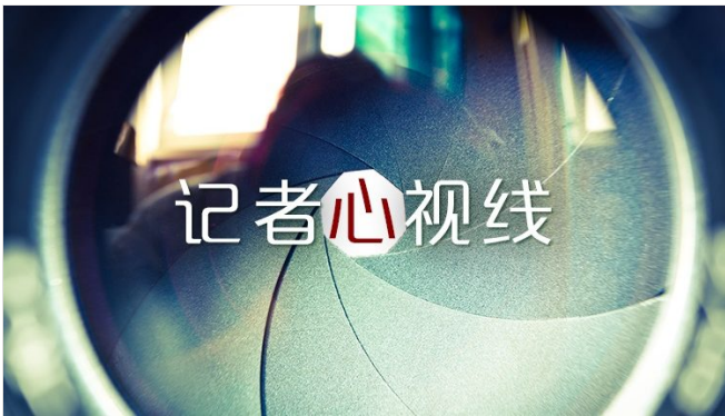
记者心视线 | 凡事不能只看表面