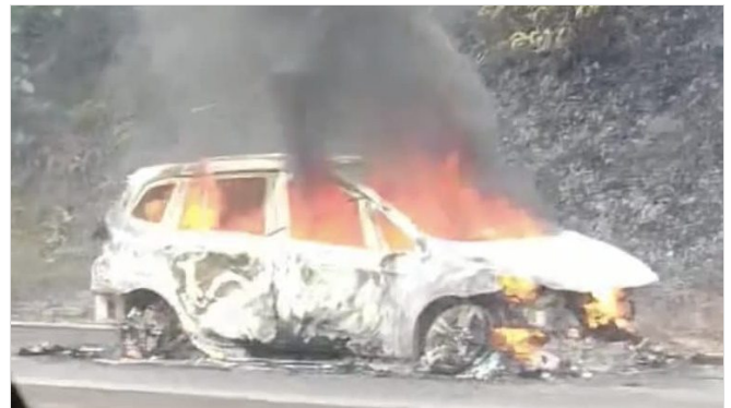
车子在南北大道著火 交通堵塞17公里