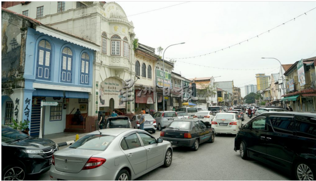
圣诞连假怡人潮汹涌 热潮将延烧至明年1月