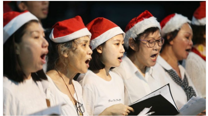
兵如港卫理公会平安夜温馨热烈 350人欢聚一堂庆圣诞