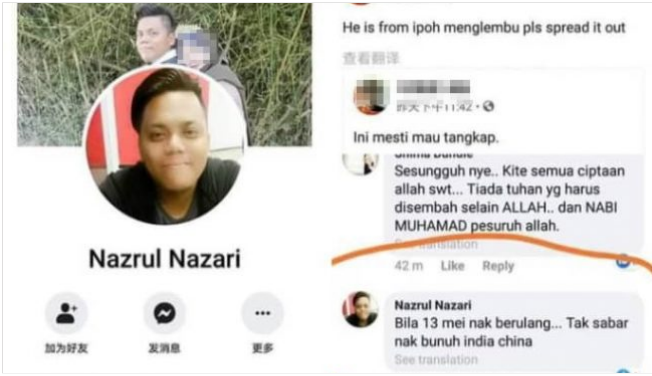
【求真】／男子513言论疯传 怡警：已被定罪 再循环旧闻